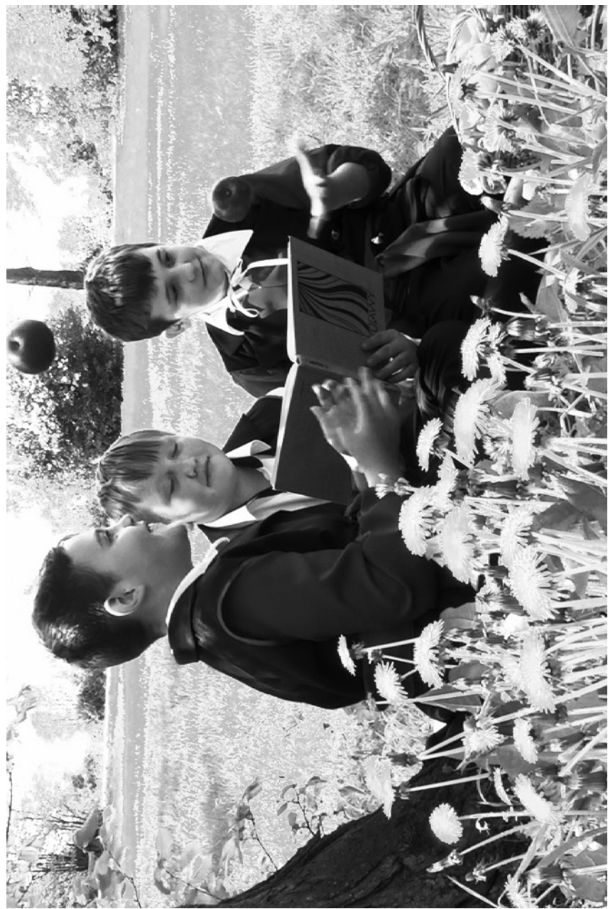
jabso - jabiko