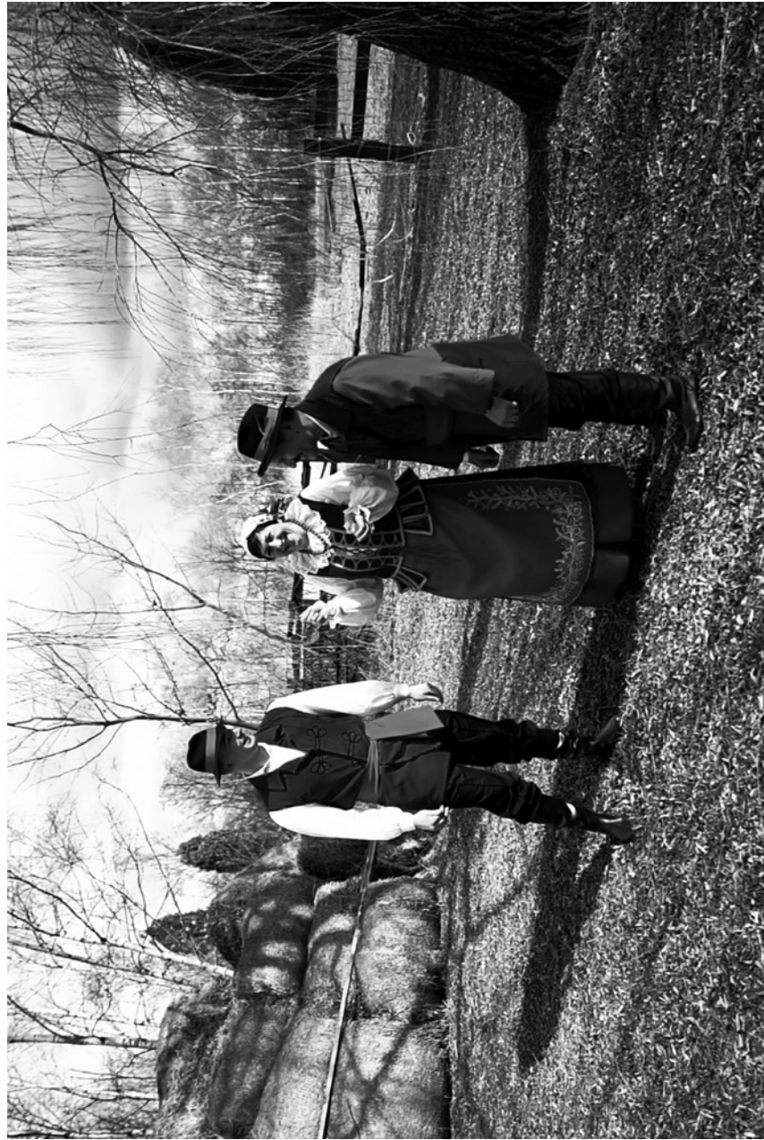
lyntol – bardzo wysoki mężczyzna