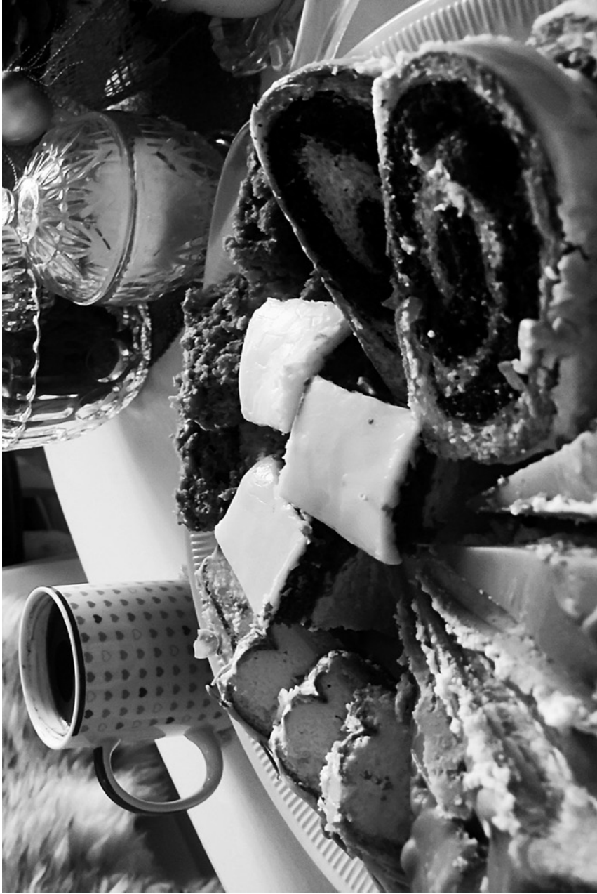
moka - kawa