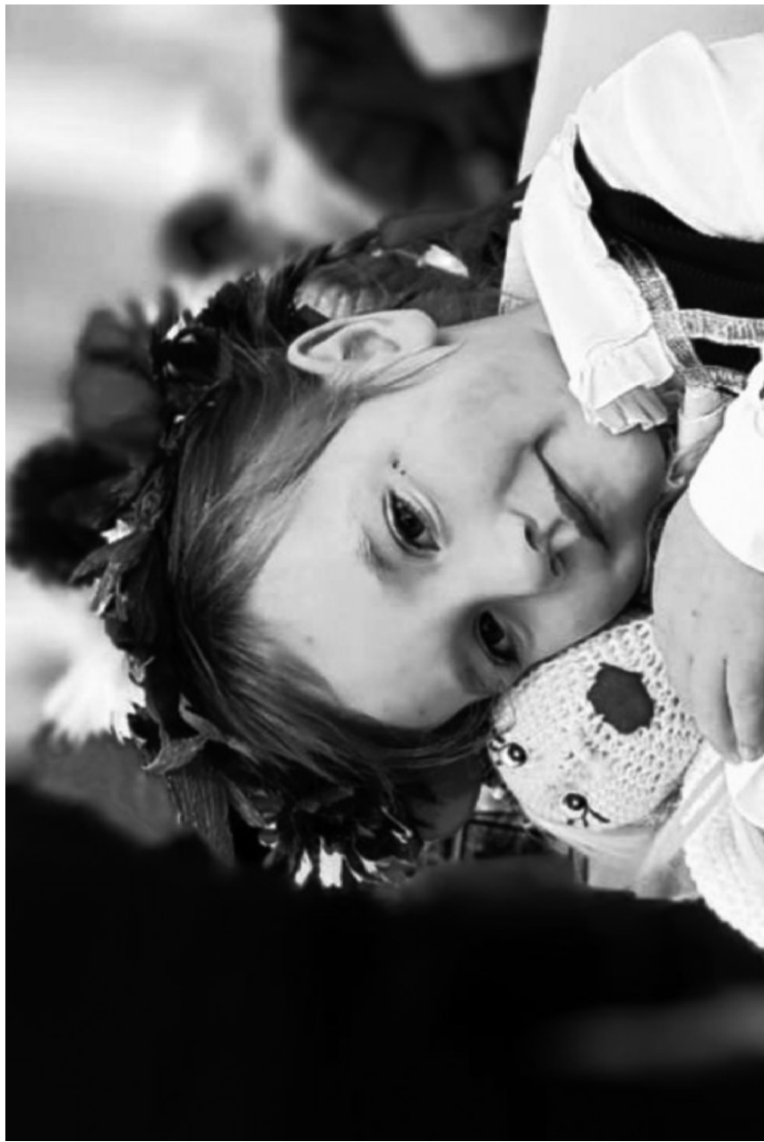
wioneczek, wionek – wianeczek, wianek