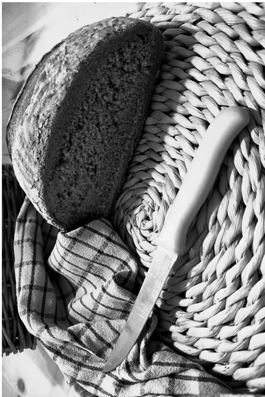
haj – nóż