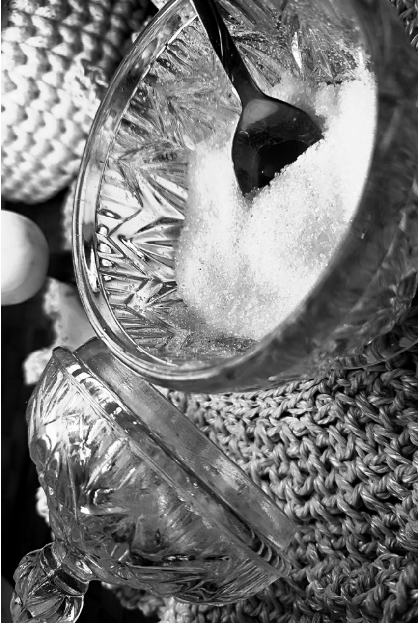
faryna – cukier