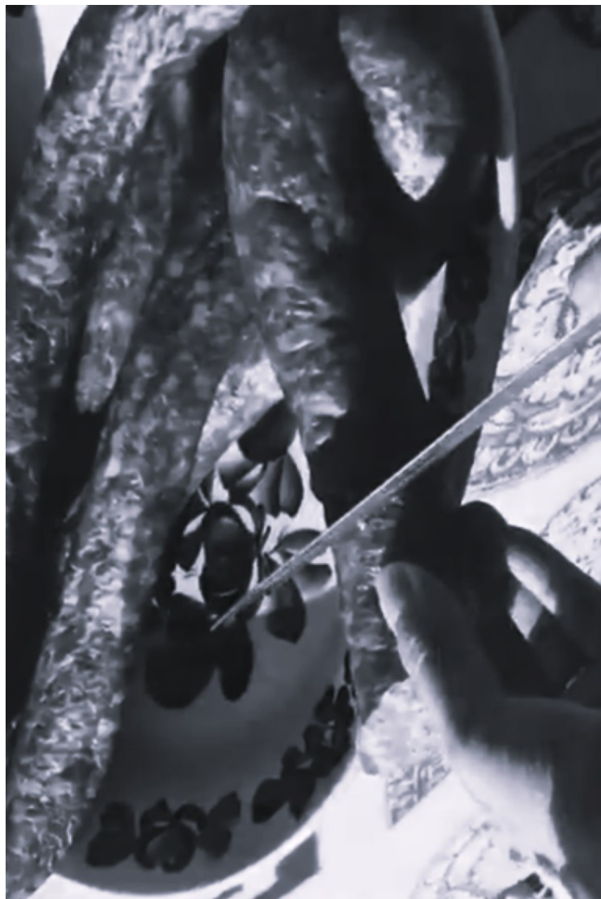
chabas - mięso