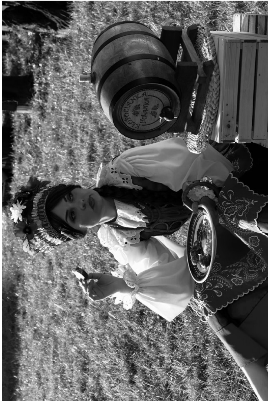
wyży, wyżyrka - wyżerka, wielkie jedzenie