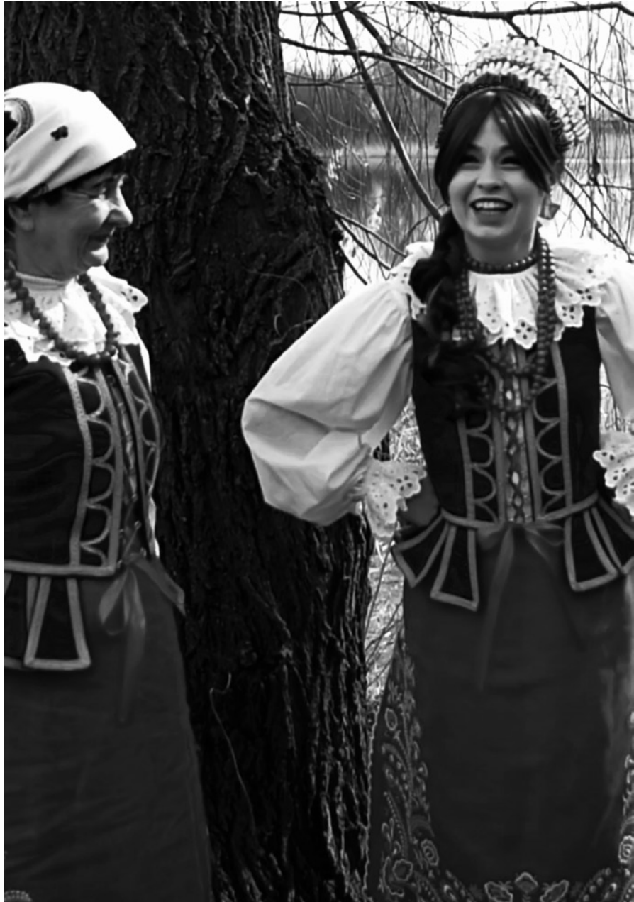
chichrać się – śmiać się