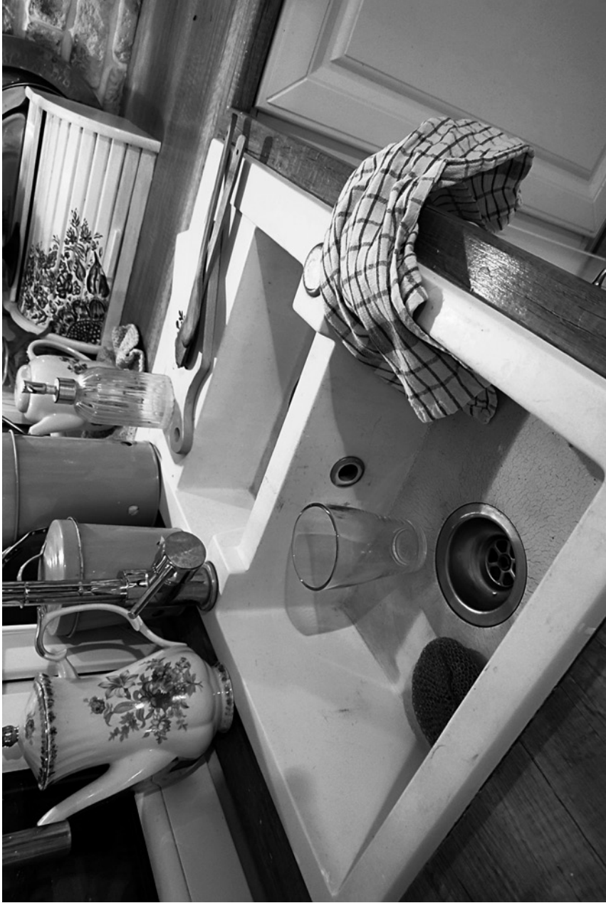
zlew - zlew