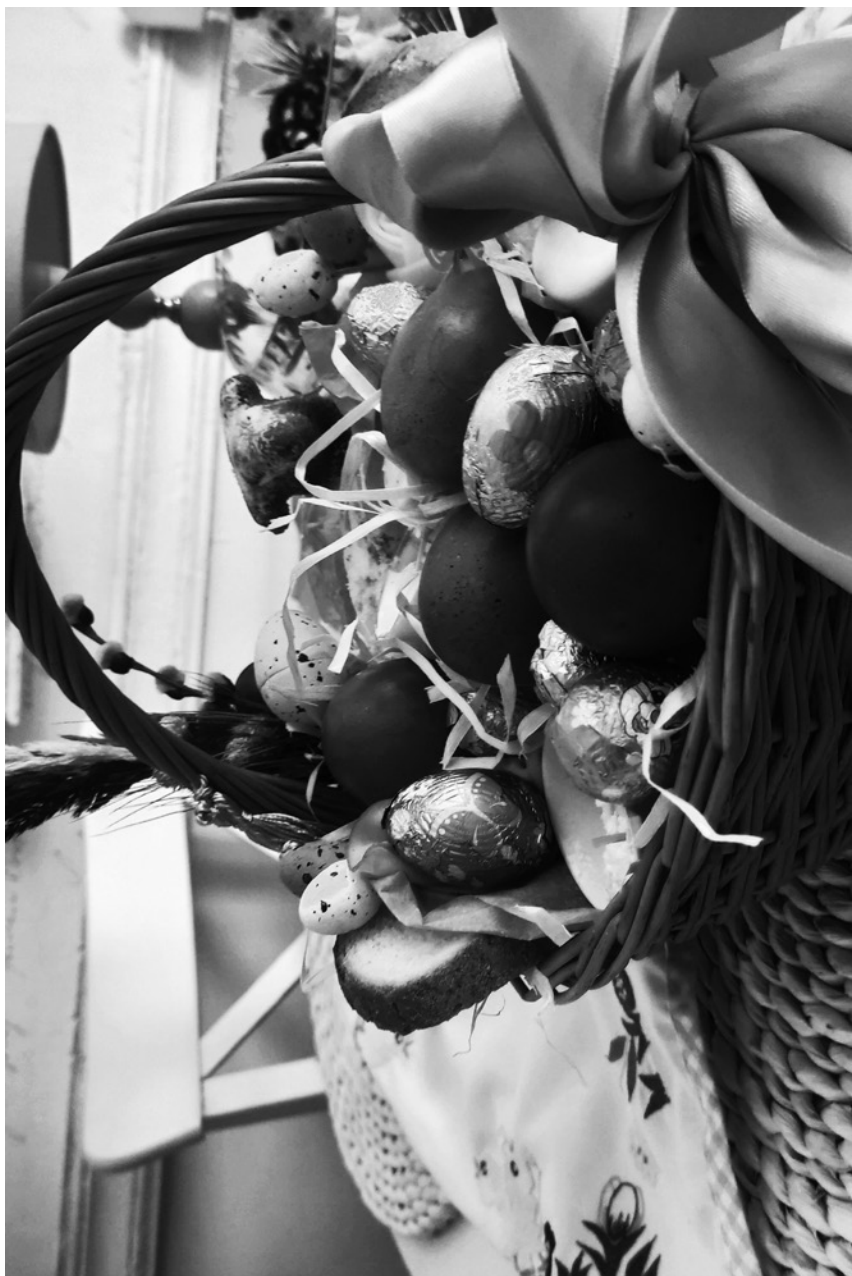
świnconka – święconka