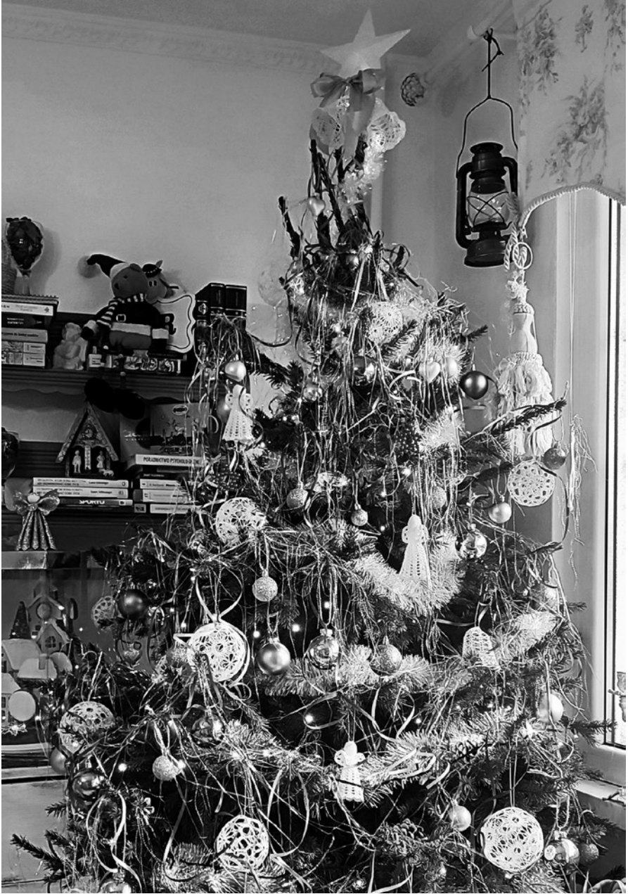
chojok – choinka