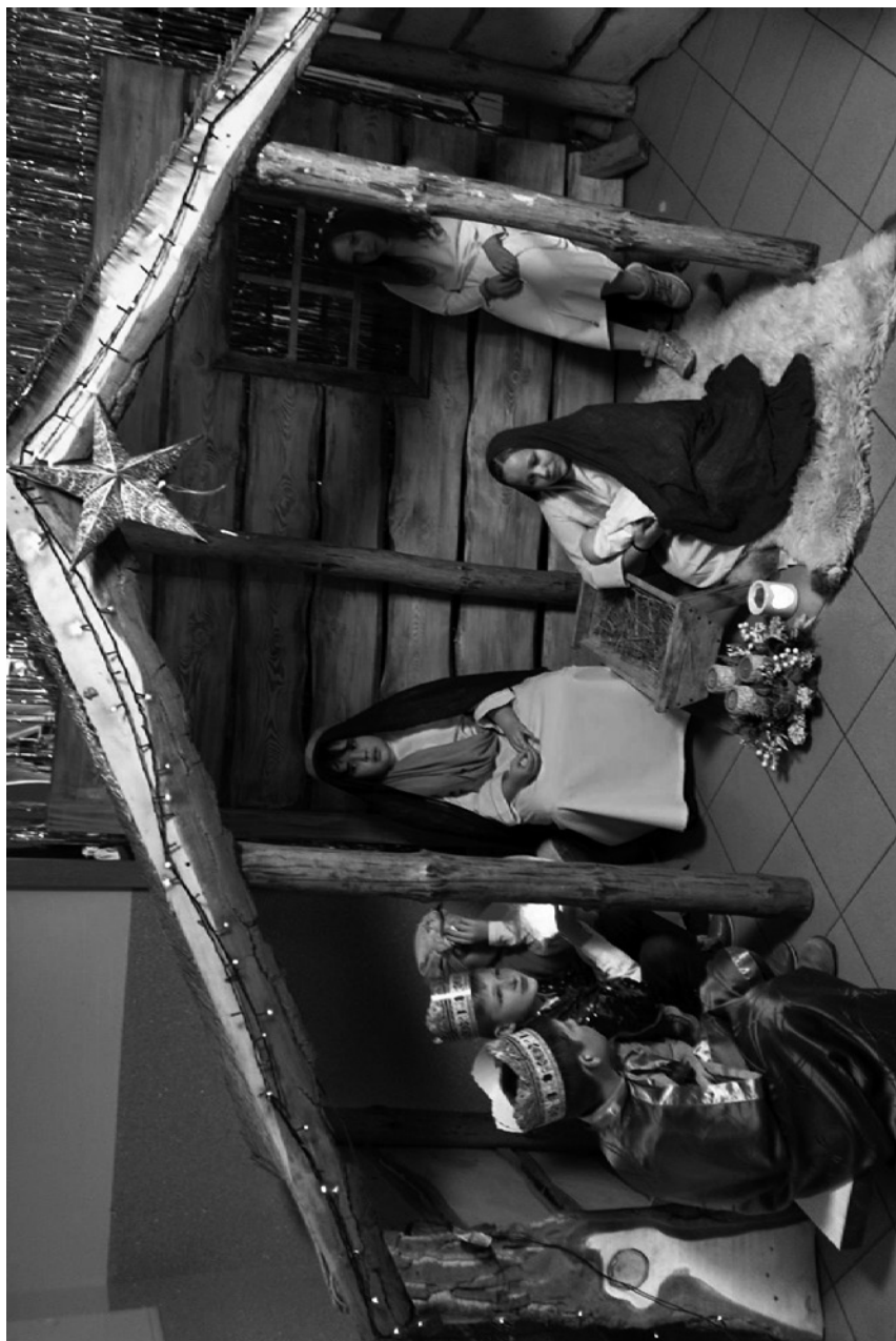
betlejsko szopka – szopka betlejska