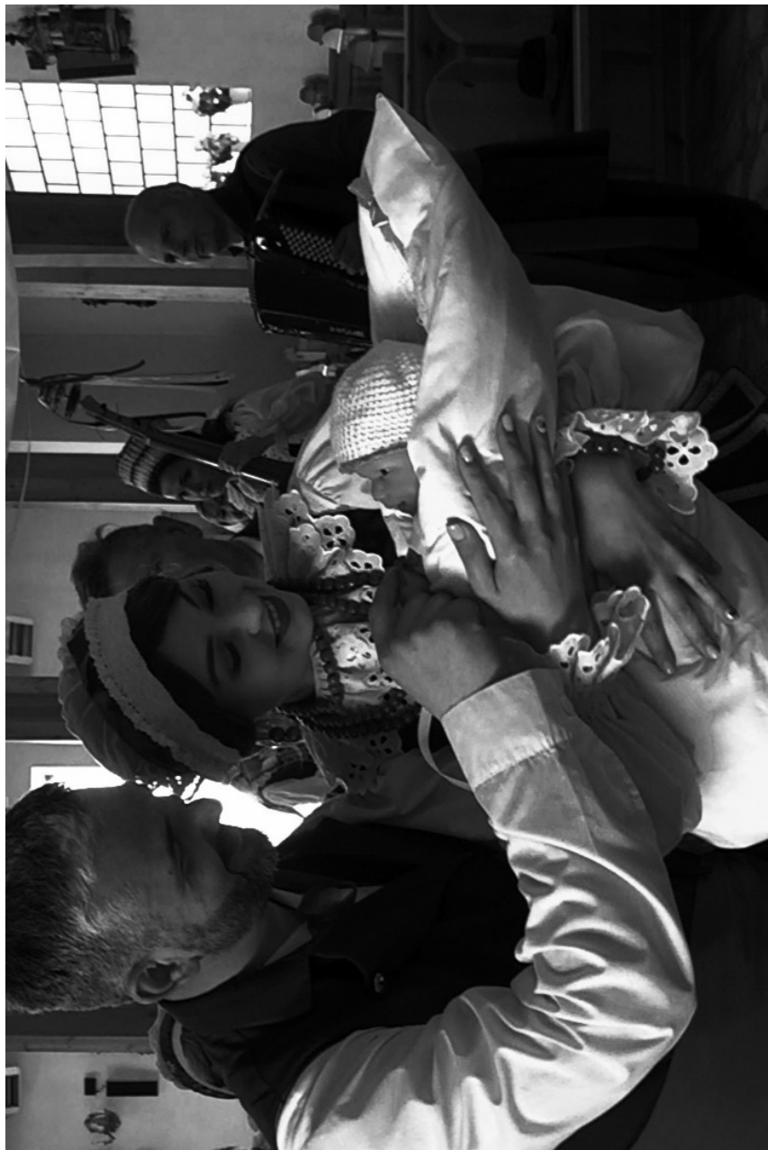
krzciny, krzest – chrzciny, chrzest