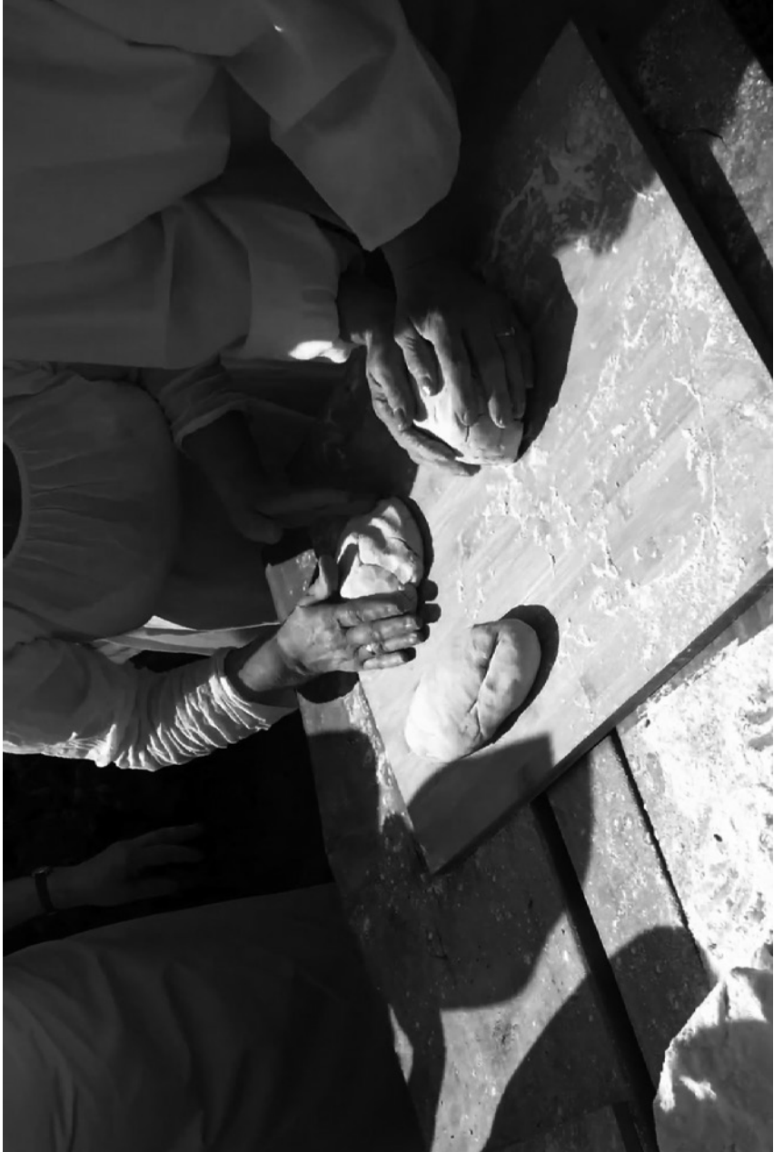
piekarz – piekarz