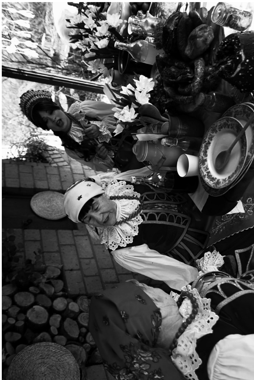
lobiod – obiad