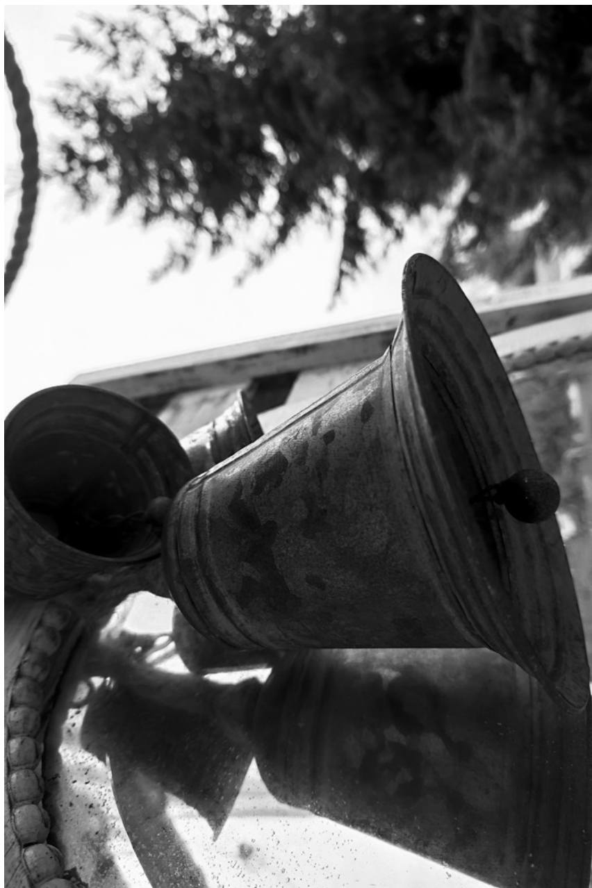
dzwonek – dzwonek