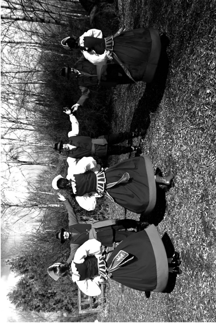
tańczenie – tańczenie