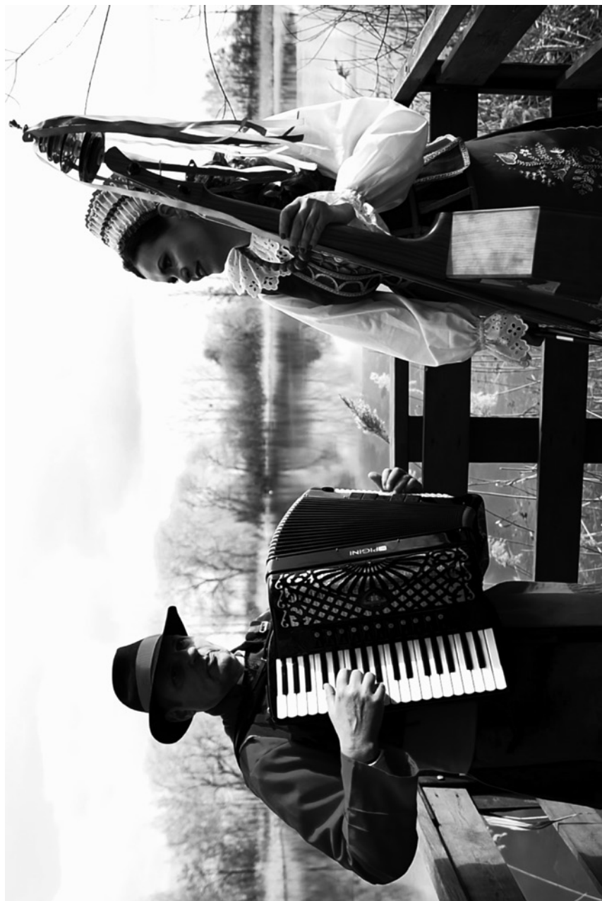
akordion - akordeon