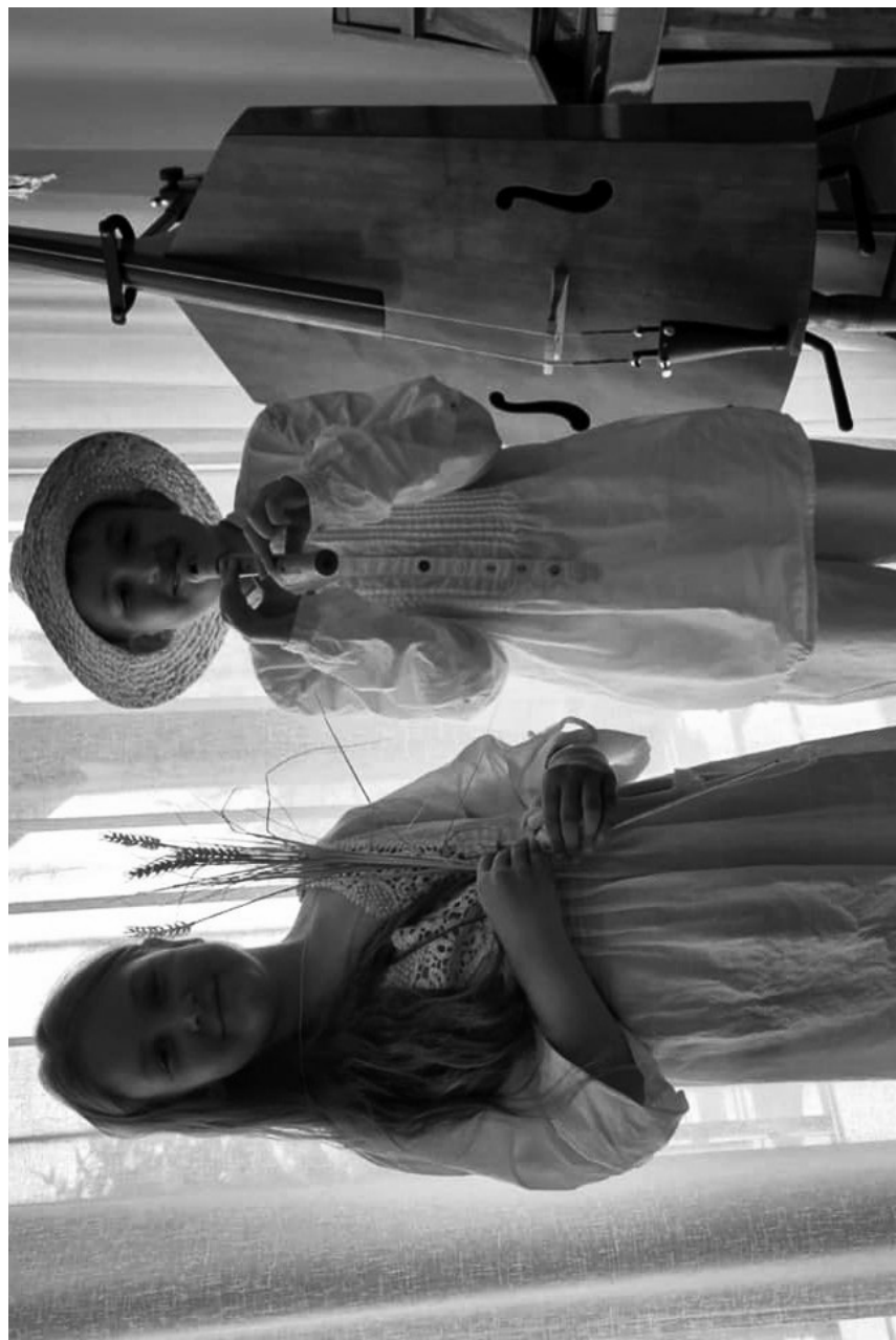
rebiata - dzieci