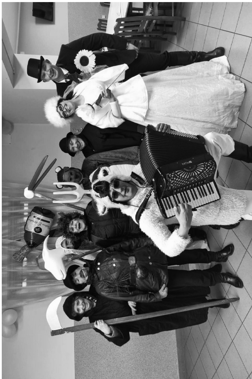
przebiraniec – przebiraniec zapustny