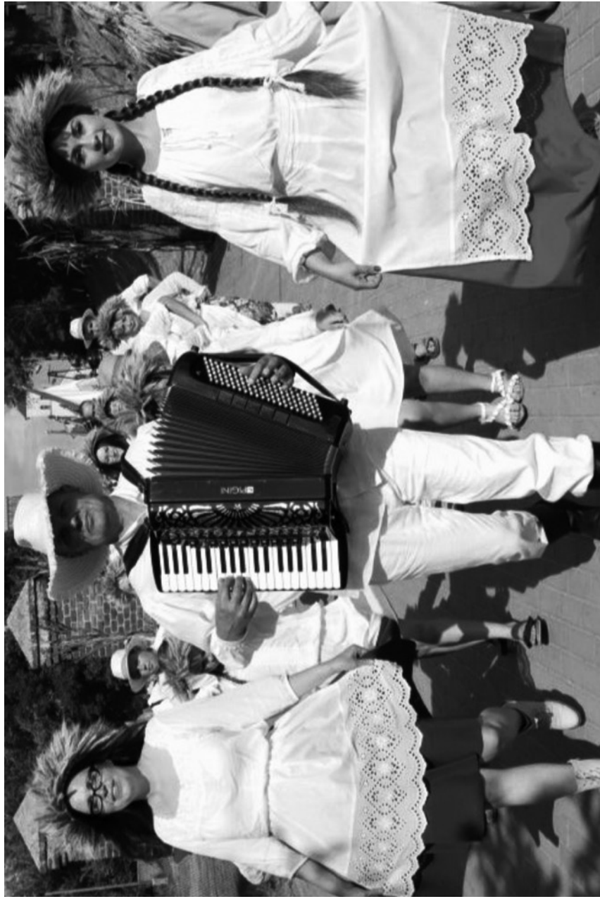
grojek – grajek, muzykant