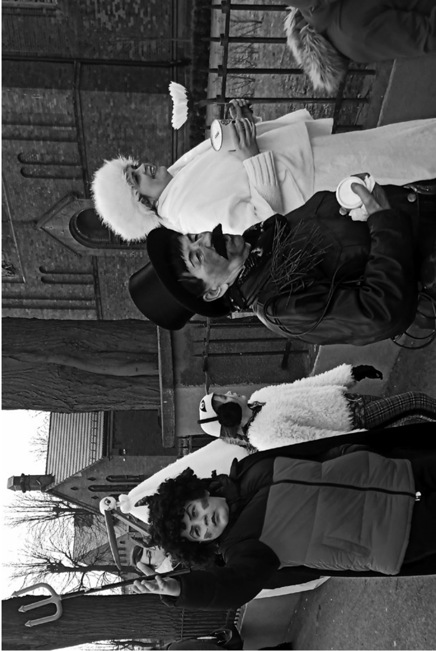
diabot - diabet