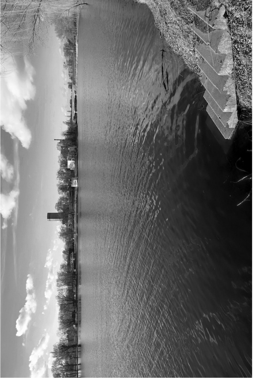
inzioro - jezioro