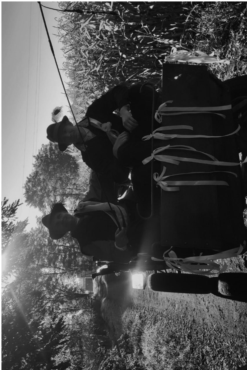
żniewicz – nowożniewicz