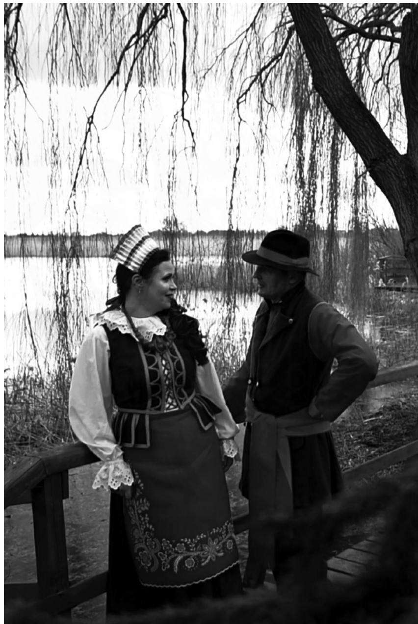
Kujawiozeczek bo jezdeś