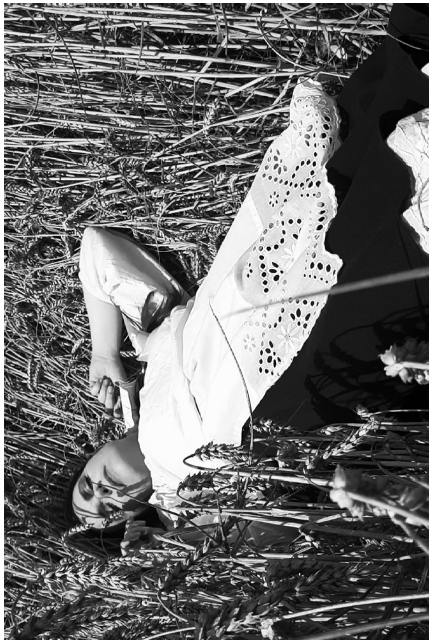
ziuzianie – spanie