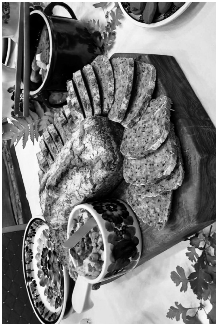
sznytka – kromka chleba