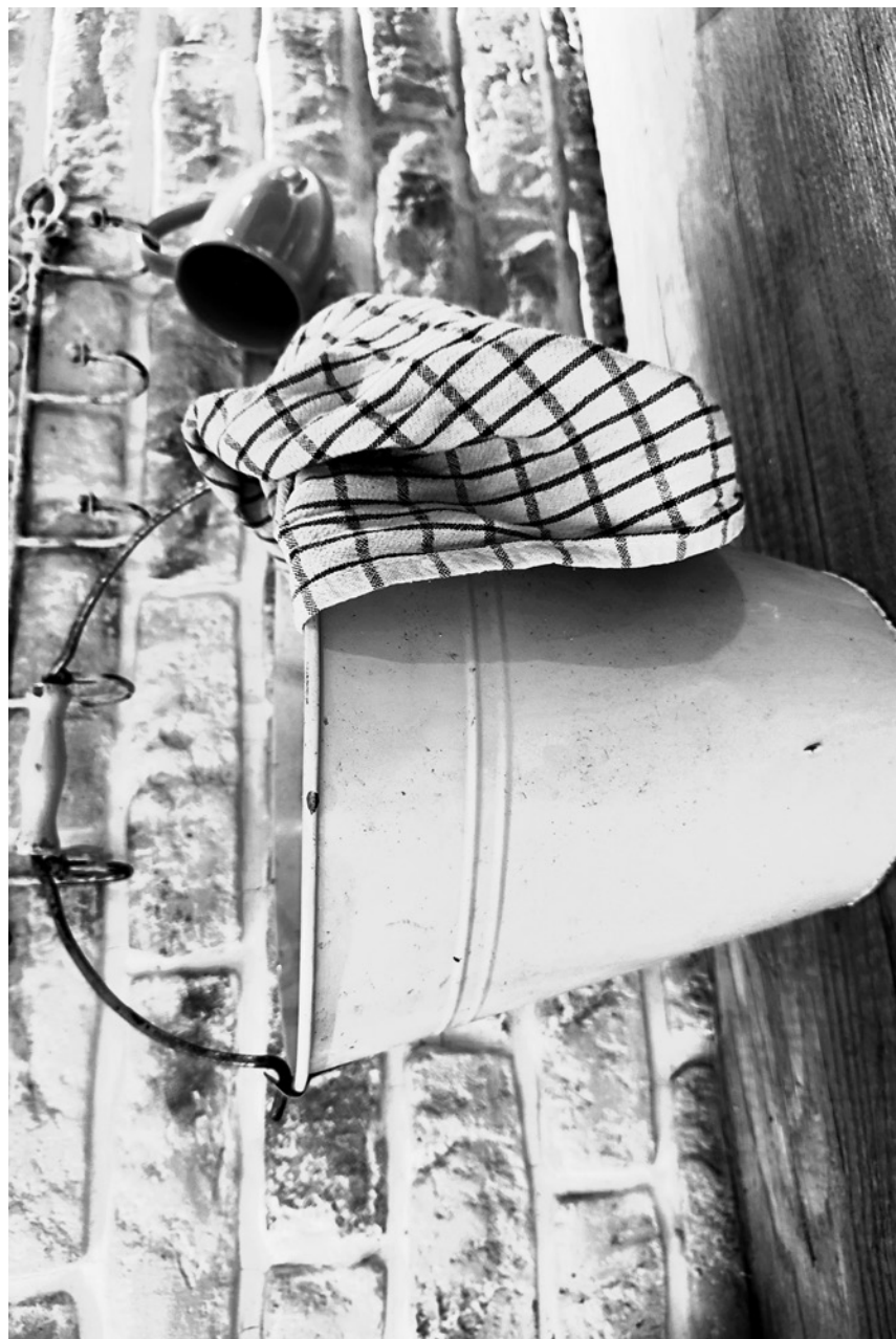
kubetek – wiaderko