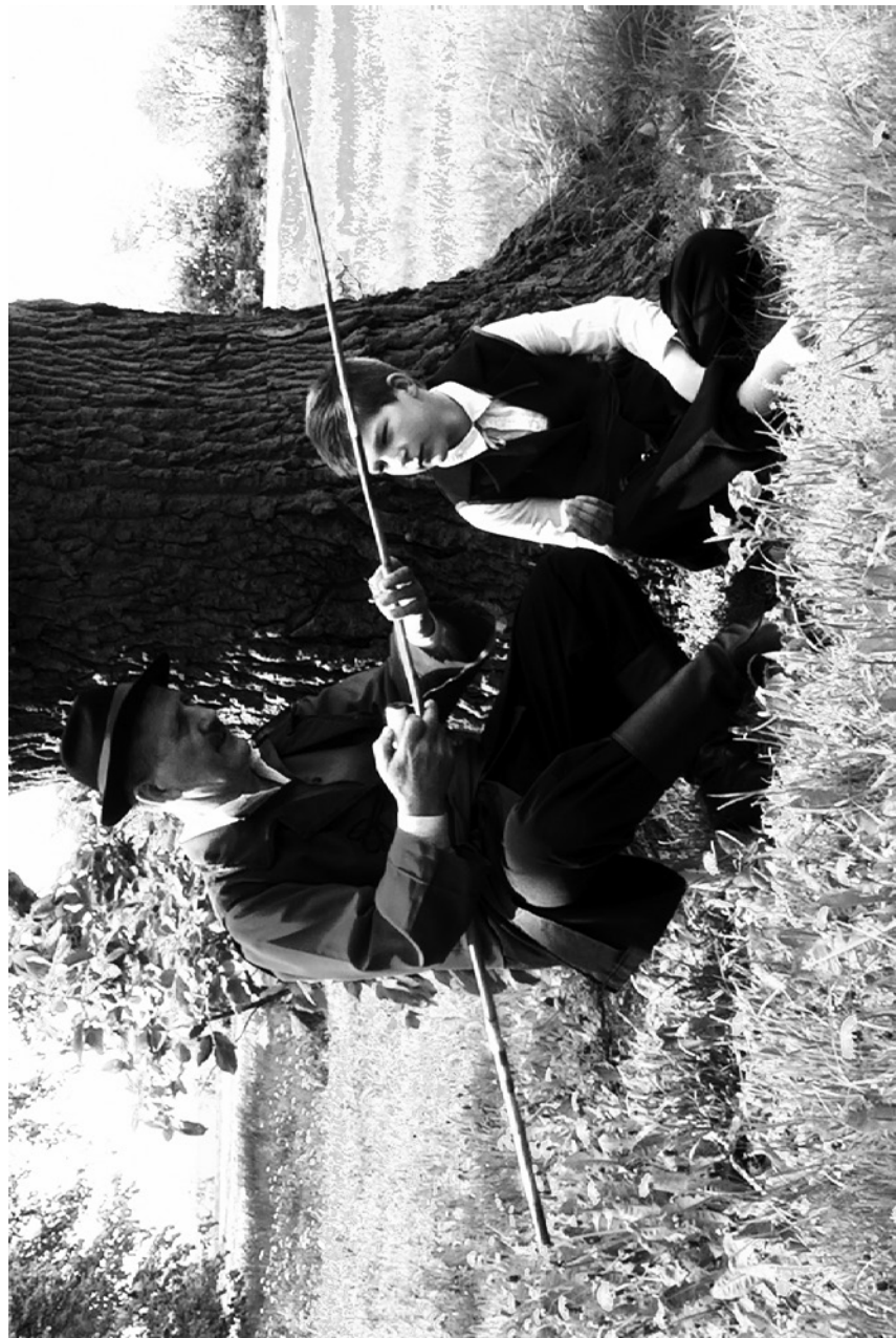
wyndka – wędka